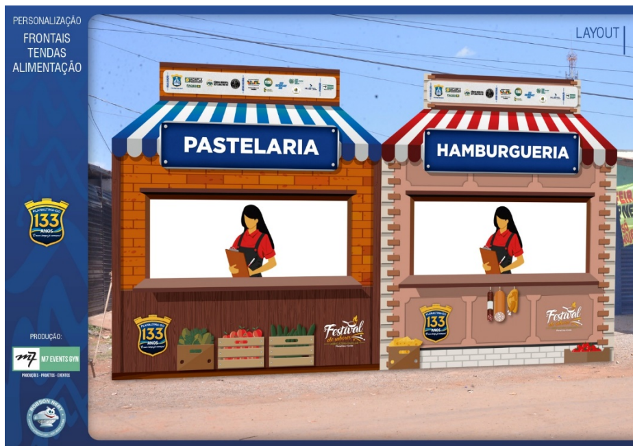
Grafico Com Modelo e Medidas das Barracas